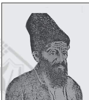
تصویر ۲. برشی از تصویر ۱