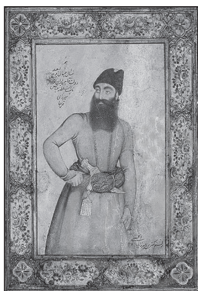
تصویر ۵. پرتره عباس میرزا قاجار