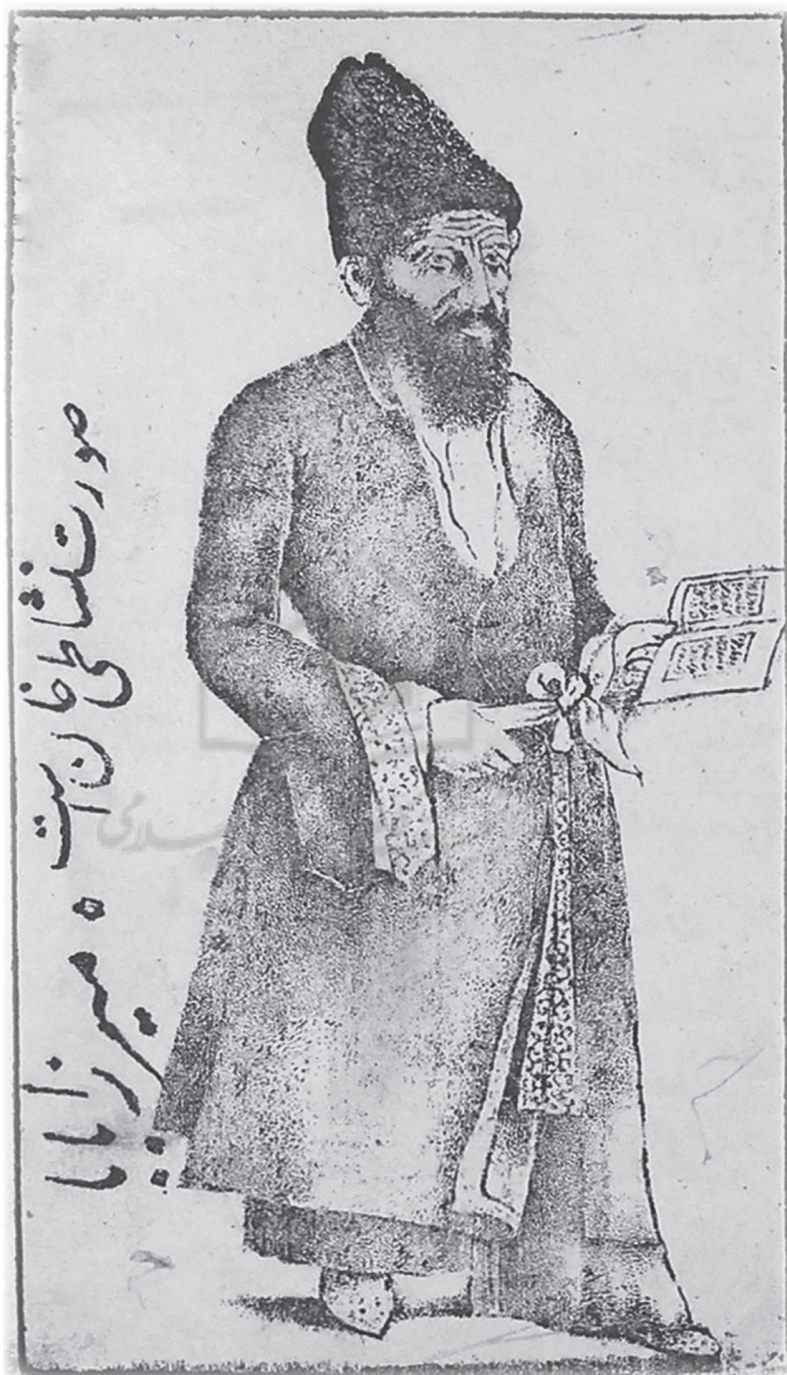
تصویر ۱. پرتره نشاطی خان در کتاب دیوان نشاطی خان. اثر میرزا بابا [امامی اصفهانی].