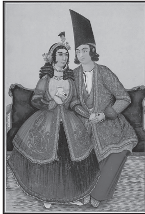
تصویر ۶. پرتره زن و شوهر عاشق، ۱۲۷۱ ق.