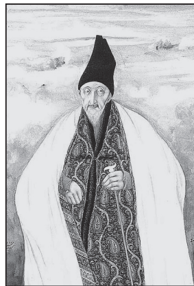
تصویر ۴. میرزا آقاسی. ۱۲۶۲ ق.

این نقاشی نیم‌تنه حاج میرزا آقاسی را در سال ۱۲۶۲ ق. در ابعاد ۱۷/۳ × ۲۴/۲ س.م. با تکنیک آبرنگ نشان می‌دهد (تصویر ۴). در این اثر، صورت میرزا آقاسی استادانه است؛ پوست صورتش چروکیده و زرد رنگ است و قیافه خواجه‌ای او را عریان می‌کند. حالت صورتش محیل و چشم‌ها کنجکاو افتاده و ریش و سبیل بزی سفیدی دارد که نقاش توانسته است قیافه حقیقی او را در کمال استادی نشان دهد. کلاهش بوقی و تیره‌ای است و لباس زیری اش نقوش بته‌جقه‌ای رنگارنگ دارد. میرزا در این پرتره با دست‌های بی‌حال خود، عصای نازکی به دست گرفته و روبه‌رو را نظاره می‌کند. روی البسه زیادی که روی هم پوشیده، عبای سفیدی هم علاوه کرده است که جثه خود را پروارتر نشان بدهد. زمینه اثر ابرهای رنگینی دارد که حالت طبیعی به آبرنگ می‌دهد. رقم نقاش به خط شکسته معمولی در طرف چپ و راست تصویر چنین است «رقم کمترین بندگان میرزا بابا حسینی ۱۲۶۲». تصویری مشابه با همین تصویر منسوب به صنیع الملک به تاریخ حدود ۱۲۶۲ ق. البته با کمی تغییر در جزئیات در کتابخانه بریتانیایی لندن به شماره ۹ folio/۴۹۳۸.Or موجود است (کریم‌زاده، ۱۳۷۰، ۱۲۸۶-۱۲۸۷).